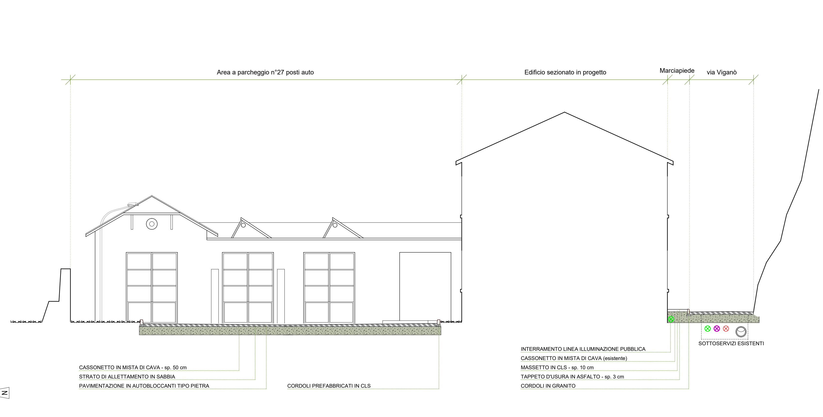
Sez. B-B' OO UU