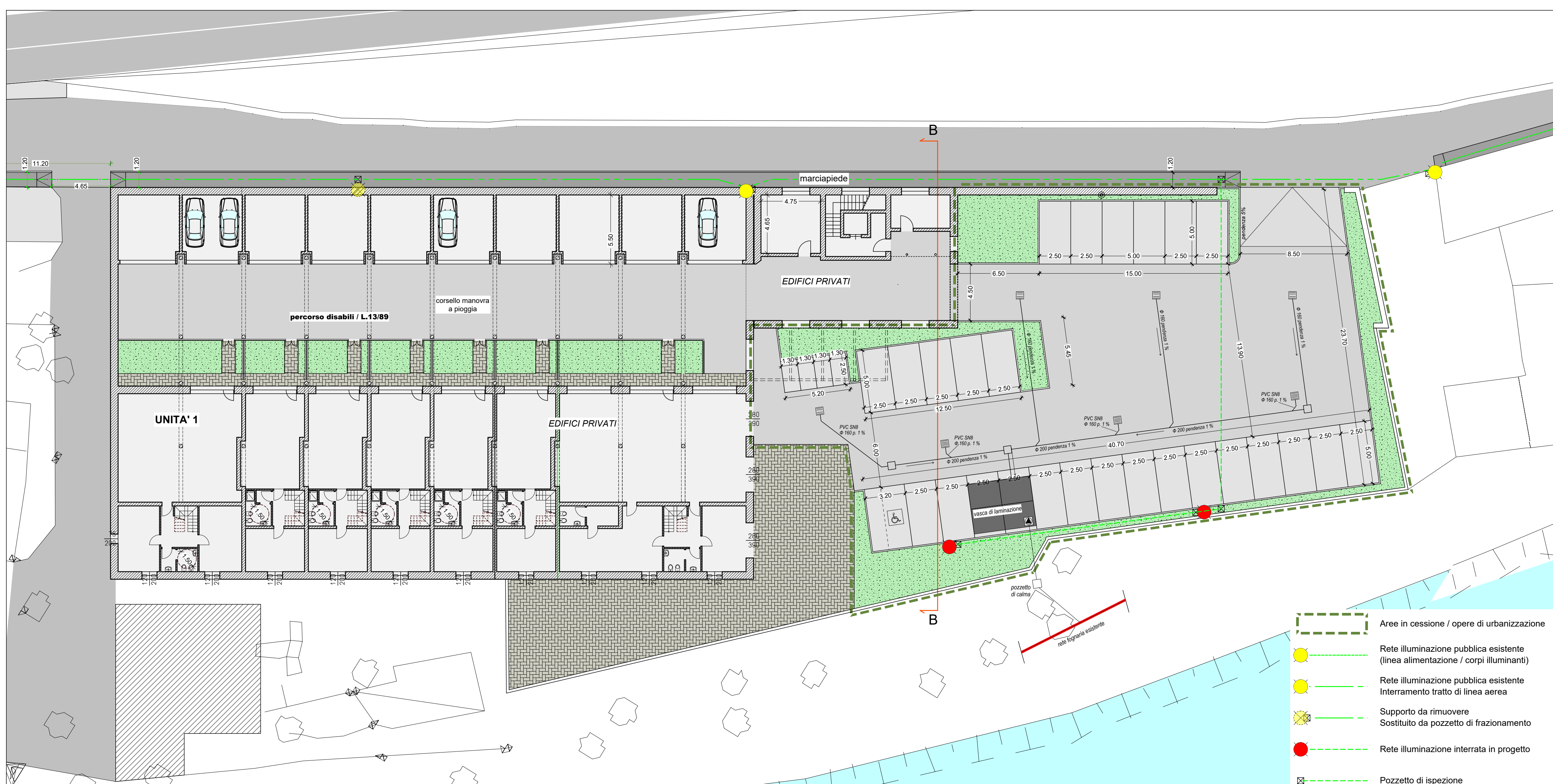
Planimetria opere di urbanizzazione in progetto